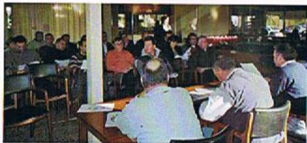
Aspecte general de l'Assemblea.

Text: Lluís Rieradevall (secretari)